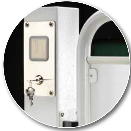
Botonera de piso