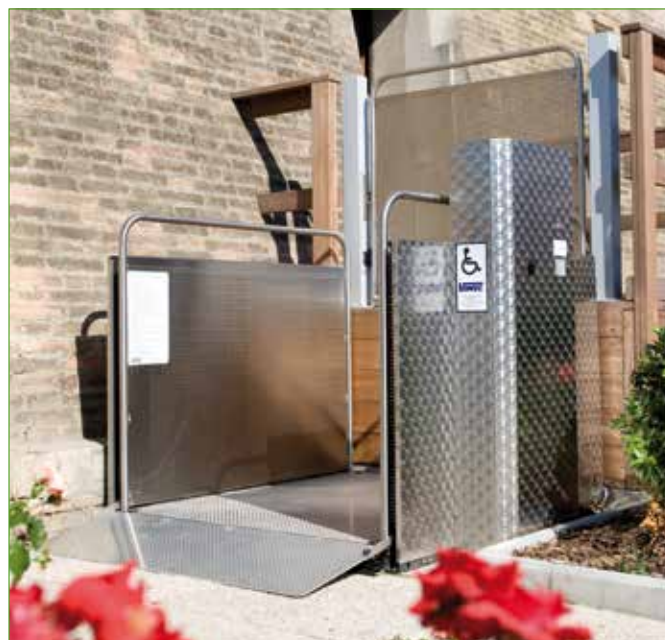
Versión de acero inoxidable (opcional)