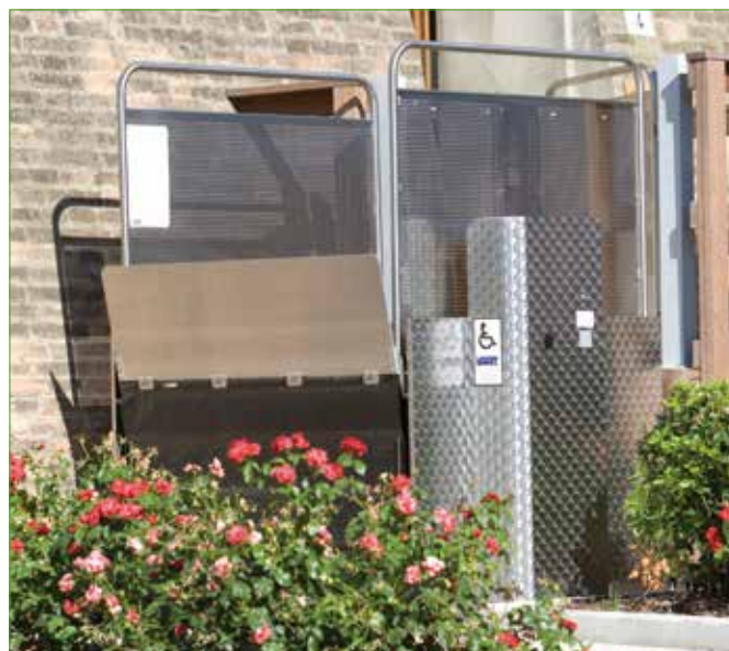
Versión de acero inoxidable (opcional)