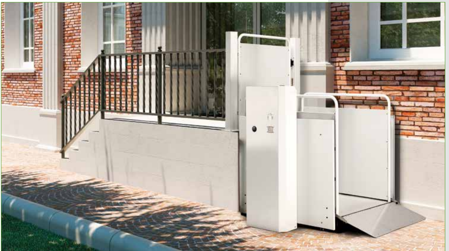
Versión estándar de acero pintado RAL 7040